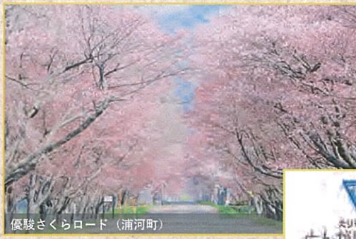
優駿さくらロード (浦河町)