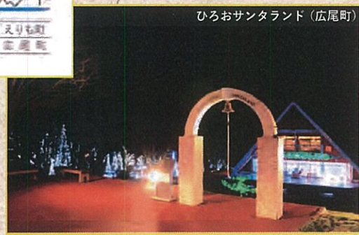
ひろおサンタランド (広尾町)